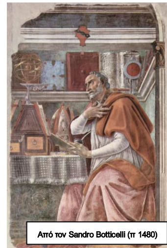
Από τον Sandro Botticelli (π. 1480)

Ένα άλλο έργο του έχει την ονομασία Εξομολογήσεις ( Confessiones ), για το οποίο μπορεί κανείς να πει ότι δεν είναι μόνο ένα φιλοσοφικό έργο, αλλά ταυτοχρόνως και μία βιογραφία του. Σε ένα άλλο έργο του που επιγράφεται Εναντίον των Ακαδημικών ( Contra academicos ), παρουσιάζει τις θέσεις του επηρεασμένου από τις ιδέες του Πλάτωνα. Με ένα άλλο έργο το οποίο υπογράφεται Περί ελευθερίας της βουλήσεως ( De libero arbitrio ), επιχειρεί ο Αυγουστίνος να εξετάσει το πρόβλημα του κακού, την ελευθερία και τον προορισμό του ανθρώπου. Έχει γράψει Περί μουσικής De Musica , ένα έργο στο οποίο συνδυάζονται οι παλαιότερες απόψεις περί της σχέσεως της μουσικής προς τον κόσμο με τις αντίστοιχες του συγγραφέως περί της χρήσεως της μουσικής ως οδού προς την θεολογία.