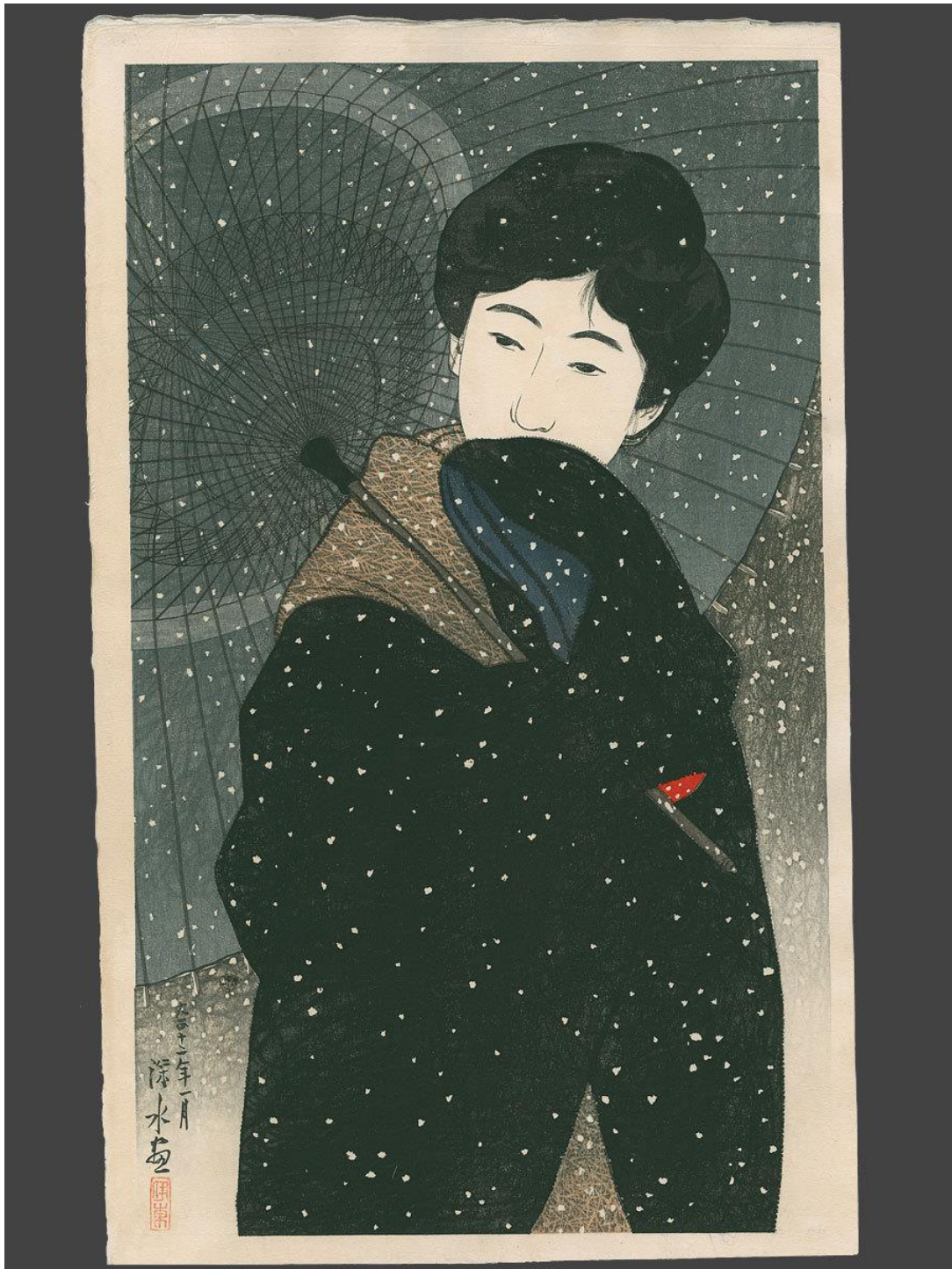
Ίτό Σινσούι "Νύχτα χιονιοῦ"