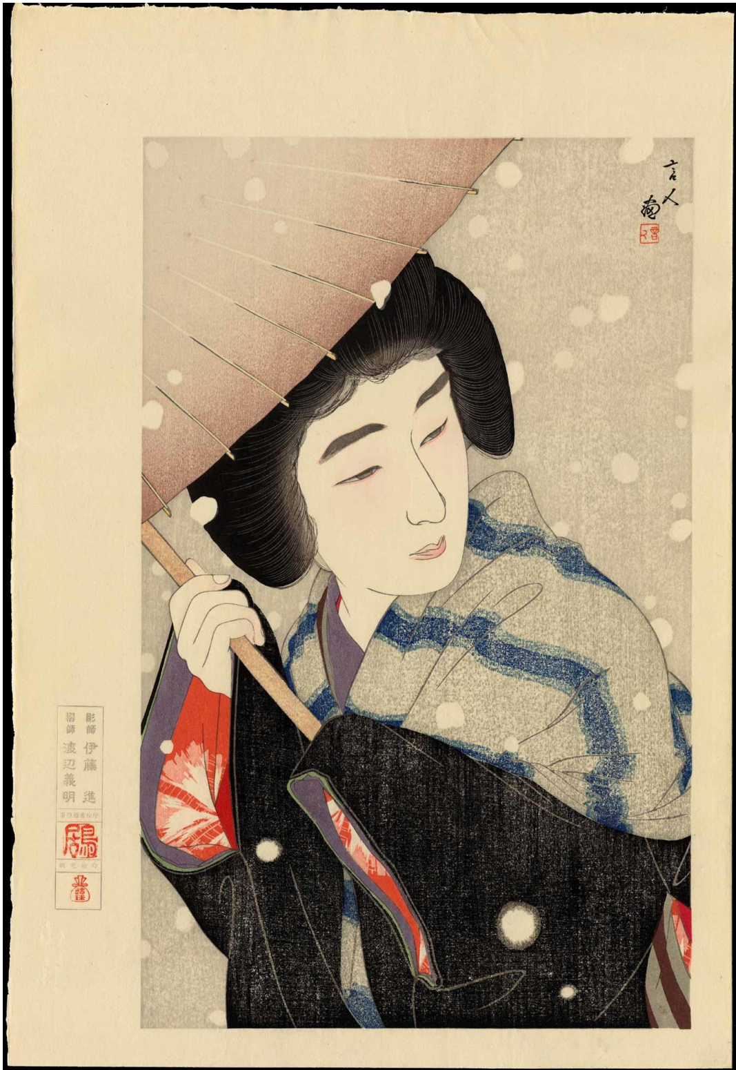
Κοτόντο Τορί "Χιόνι σαν πέταλα παιώνιας"