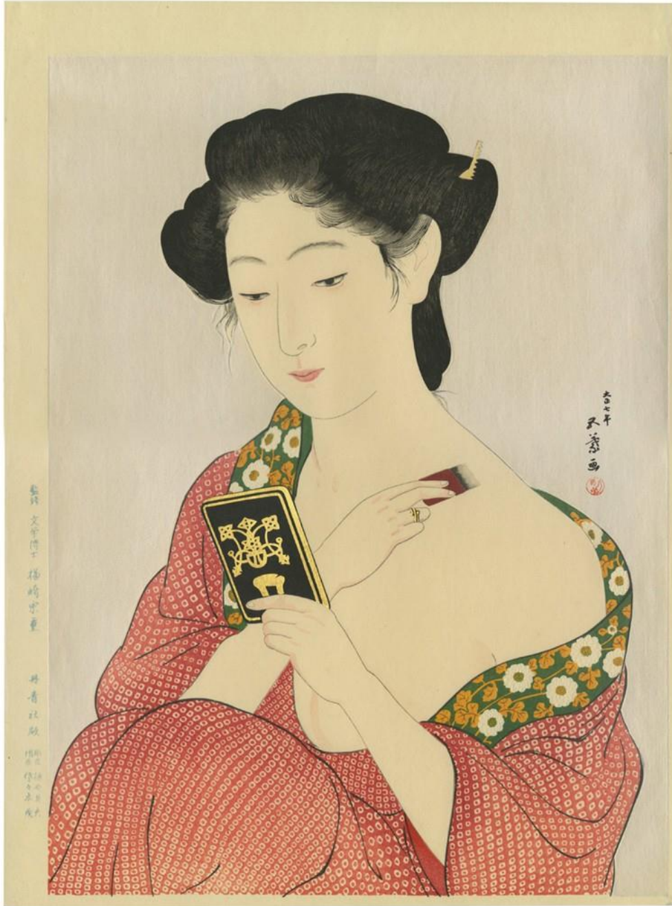
Χασιγκούτσι Γκογιό "Γυναίκα που βάζει πούδρα".